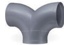
Bestellbeispiel: TV45-PPS-Ød 1 -Ød 3