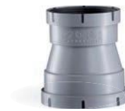
RCEFFI-PPS-Ød 1 -Ød 2

Reduzierung symmetrisch aus PPs als Stecksystem mit eingespritzter Lippendichtung, Muffenmaß.