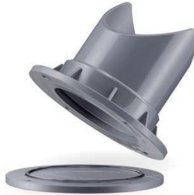
Bestellbeispiel: TRD-PPS-Ød 1 -Ød 3

Reinigungsöffnung aus PPs für bauseitigen Einbau mit O-Ring Dichtung für Muffenanschluss. Bitte Dichtwerkstoff PVC-P oder EPDM bei Bestellung angeben.